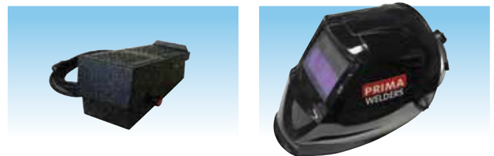
PCAD cod. 982002