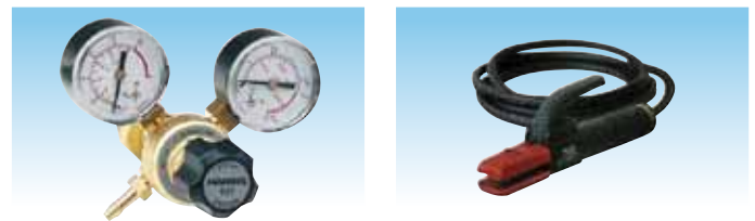
RDP cod. 981012